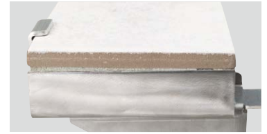
目地が露出しないノイズレスデザイン