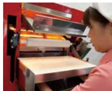
②めん棒を本体にセットします。