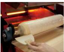
④へらを使って形を整えます。