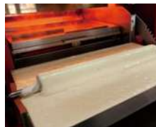
③ハンドルを操作し、めん棒に生地を付けます。