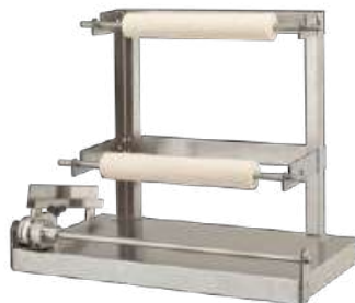
めん棒専用ラック