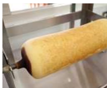
⑥焼成後ラックに掛けます。