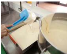
①生地を本体にセットします。