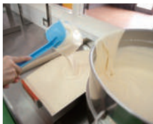
①生地を本体にセットします。