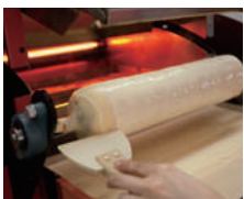
④へらを使って形を整えます。