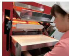
②めん棒を本体にセットします。