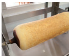
⑥焼成後ラックに掛けます。