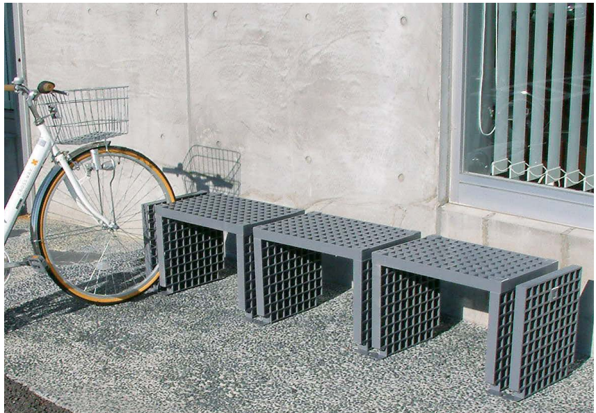
YC-03 (3連式) / グレー