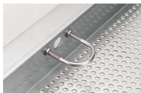
取り外しに便利な取手付き