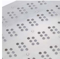
排水穴・ハーフシャワー