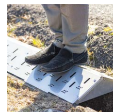
施工イメージ 人が載っても耐えます